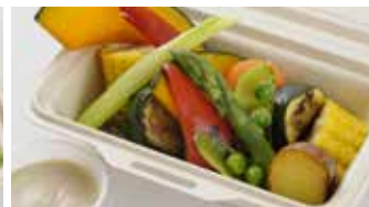
野菜ソムリエ厳選 ベジタブル BOX 700円(税込)