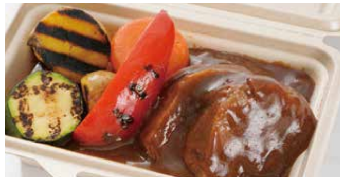
8時間煮込んだやわらか牛タンのブルギニョン BOX ライス付き / 1,800円(税込)