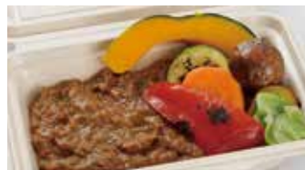
クルーズクルーズ新宿特製 ビーフカレー BOX ライス付き / 900円(税込)