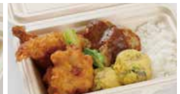
お子様プレート BOX (ハンバーグ・エビフライ・チキンフリット・ ポテトサラダ・ライス) ライス付き / 500円(税込)