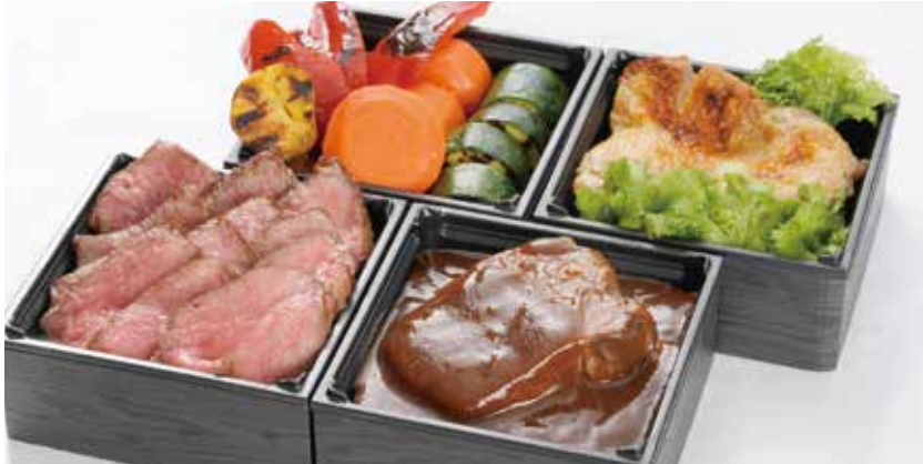
パーティーミート BOX 【3～4名様用 5,000円(税込)】