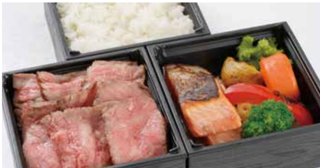
黒毛和牛ステーキと ORA キングサーモンロースト BOX ライス付き / 3,500円(税込)