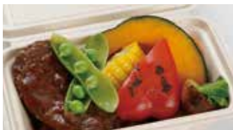
オリーブオイルで焼き上げた 黒毛和牛入りハンバーグ BOX ライス付き / 1,500円(税込)