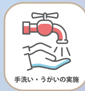
手洗い・うがいの実施