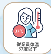
従業員体温 37度以下