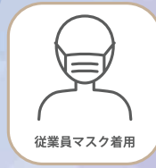
従業員マスク着用