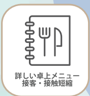
詳しい卓上メニュー 接客・接触短縮

卓上に詳しいお食事内容を 記載したメニューをご用意し ご説明の時間を短くいたします