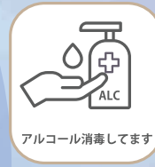
アルコール消毒しています