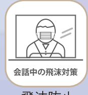
会話中の飛沫対策