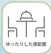
ゆったりした席配置

卓上に詳しいお食事内容を 記載したメニューをご用意し ご説明の時間を短くいたします