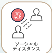
ソーシャル ディスタンス